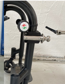
Foto 4 Foto des Seitenhakens in Nahaufnahme von außen.

Fotografieren Sie den Rollstuhl aus einer niedrigen, frontalen Position mit Haken ausgestattet.