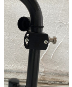
Foto 5 Fotografie des Seitenhakens von innen aus der Nahaufnahme.

Bitte senden Sie Fotos an eine der folgenden E-Mail-Adressen und geben Sie die Produktcharge an: info@pandhora.it